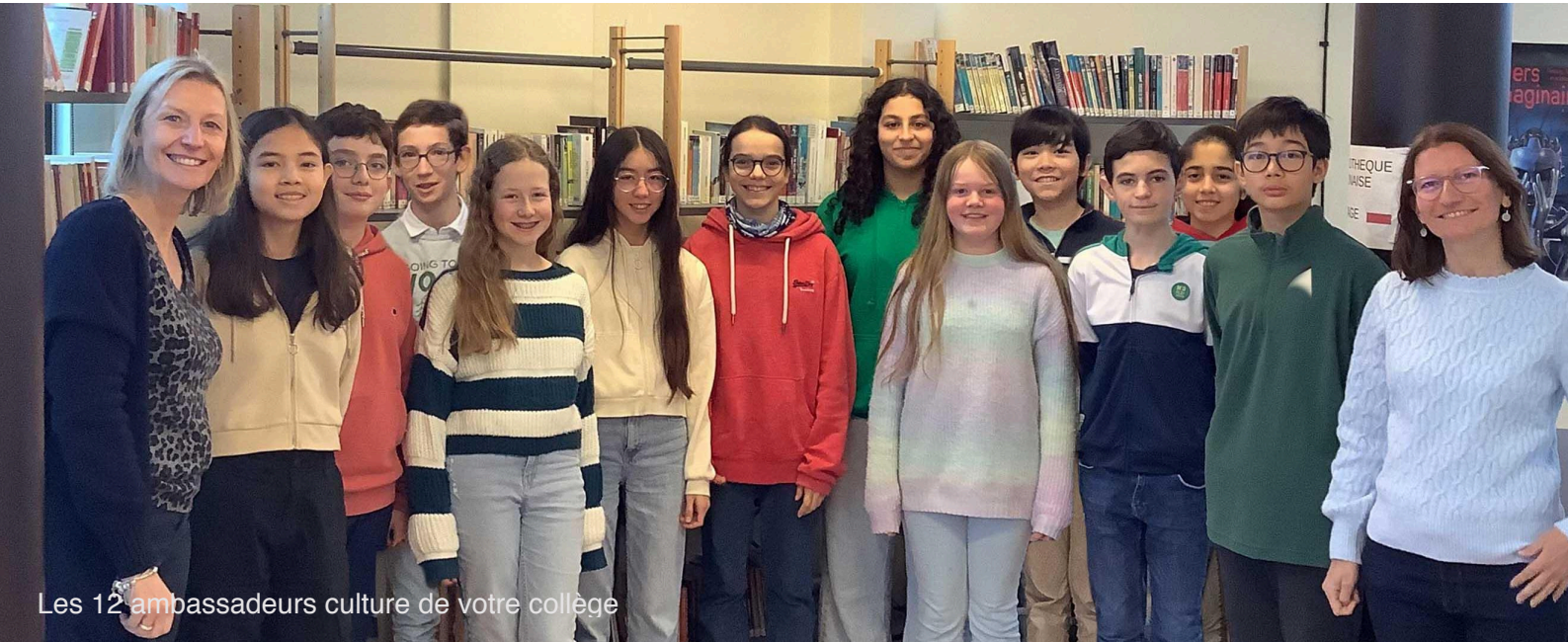
Les 12 ambassadeurs culture de votre collège

Chers lecteurs, nous sommes les 12 Ambassadeurs Culture du collège.